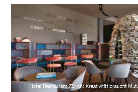
Hotel Restaurant Zürich: Kreativität braucht Mut.