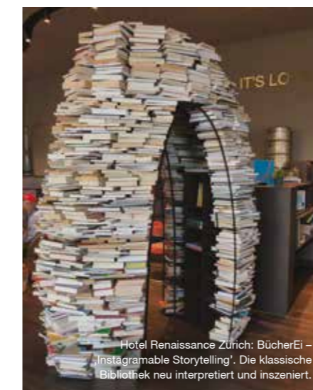
Hotel Renaissance Zürich: BücherEi – ‚Instagramable Storytelling‘. Die klassische Bibliothek neu interpretiert und inszeniert.