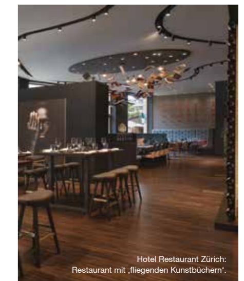
Hotel Restaurant Zürich: Restaurant mit ‚fliegenden Kunstbüchern‘.