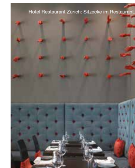
Hotel Restaurant Zürich: Sitzecke im Restaurant.