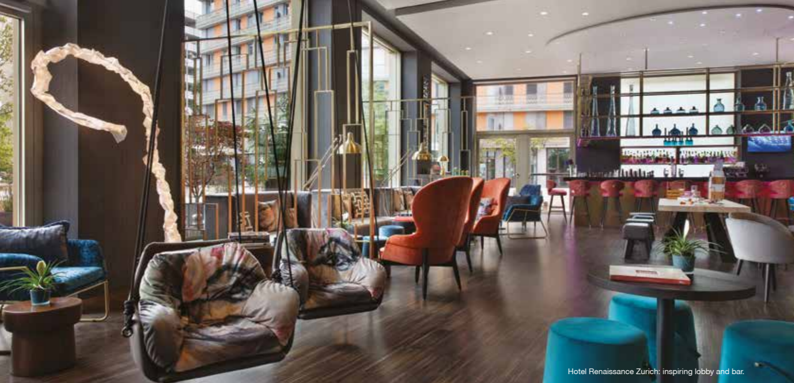
Hotel Renaissance Zurich: inspiring lobby and bar.